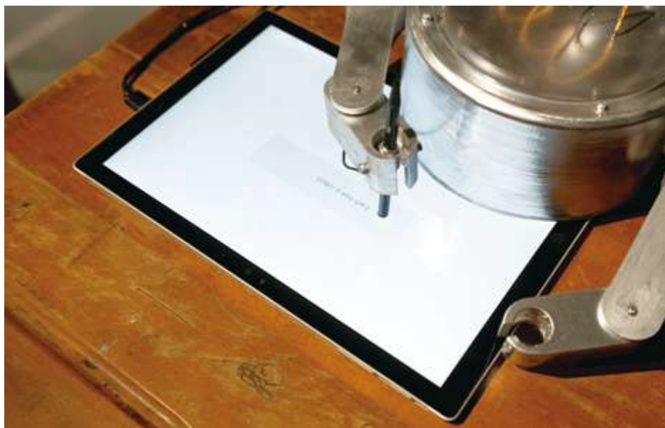
▲ 鄭子芸 x 張益誠《我不是機器人》

第一畫廊展示藝術家鄭子芸 x 張益誠《我不是機器人》等作品，創作發想源自網路世界中數種驗證之一：使用者勾選「我不是機器人」選項。此系統的設置，恰恰凸顯出人、機界線正趨向模糊才需要驗證。