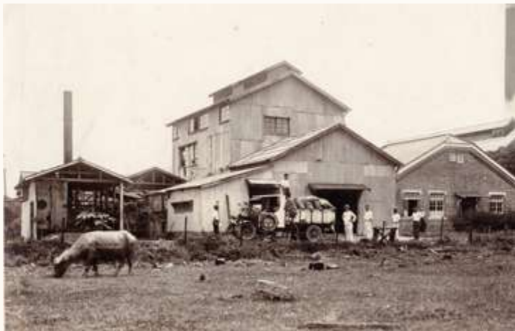
▲ 白河農場的古柯葉乾燥後送往新營工廠再製古柯鹼 / 劉興吉