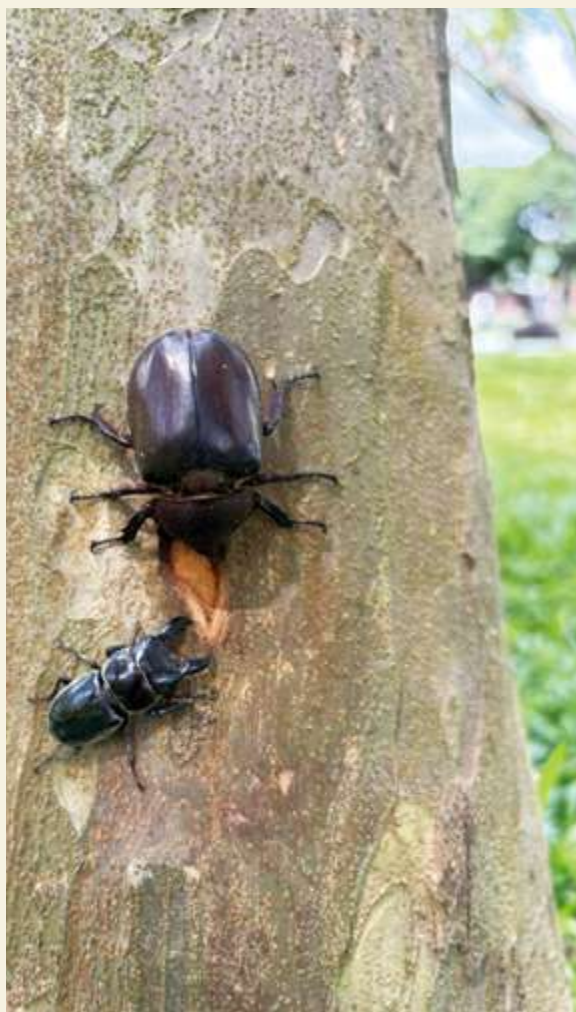
▲ 獨角仙與鍬形蟲 / 張家瑜