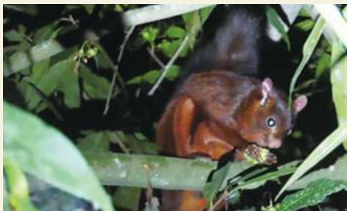
▲ 大赤鼯鼠 / 張家瑜