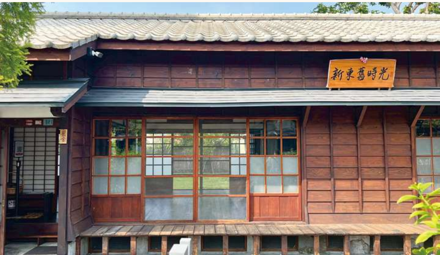
▲ 位於臺南市新營區大同路的「臺灣生藥株式會社」（藥仔會社）員工宿舍，現已修建為「新東舊時光」，展示珍貴的古柯產業歷史 / 陳文彥

日治時期，作為殖民地的臺灣，曾經是日本國內發展古柯鹼生產製藥的原料供應地，而臺灣種植古柯的所在地之一，就在百年前的臺南白河山區。過去這段歷史，因為古柯具有「藥」與「毒」的特殊身份，便被刻意隱藏，僅在當地少數耆老口中還留有「藥仔會社」的歷史記憶。