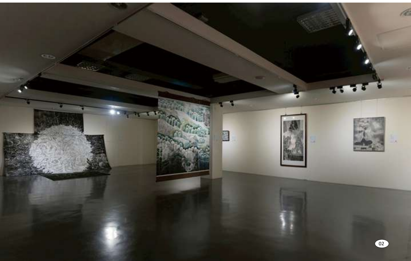
▼ 2024 南瀛獎展覽空間一景

榮獲 2024 南瀛獎的藝術家及其作品有：李迪權作品《聖徒》、廖昭豪作品《內牆風景採集計畫》、鄭子芸+張益誠作品《我不是機器人》。我們觀察到這些作品充分展現「反身日常」現象，藝術家以其創作，採取一種反身回顧（Reflexive Review）並進行反身話語分析（Reflexive Discourse Analysis）的藝術語言，再將之整合為反身性實施的創作方法。