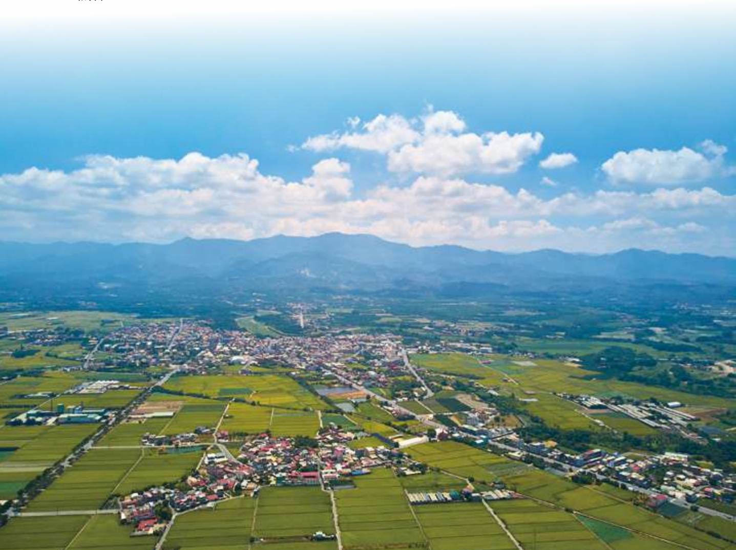
▲ 從海岸向山區前行，不同地形有著各自衍生的生態系

「生態系」是指在一個「特定的地理區域」內，所有「生物」群體與「非生物」之環境條件，如空氣、水、土壤、陽光所構成相互依存、交互作用的一個整體。從生態系命名的方式，不難看出一個地區主要的「氣候」與「環境」，跟當地最常出現的植被有直接關係。