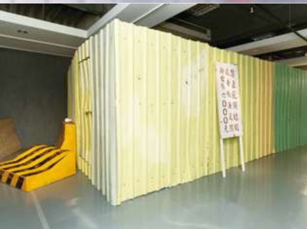
▲ 廖昭豪《內牆風景採集計畫》

鐵皮牆上的破洞，讓觀者透過破洞聚精會神地去觀看，因而看到藝術家所採集的各式社會議題相關景象，注意到生活中習以為常而未曾注意、思慮的層面，皆透過藝術作品的觀看，重新反身日常。