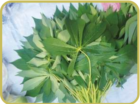
▲ 市場上的新鮮樹薯葉，是東南亞新住民、移工的美味食材