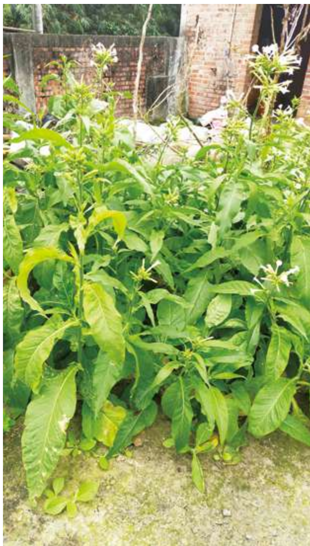
▲ 內枋林彭家菸樓前仍種有幾株菸葉植物

多數人對於白河的第一印象是「蓮花、溫泉、甕仔雞」，近幾年在臺南市政府客家事務委員會、白河區公所、店仔口文教協會與地方人士用心規劃推動下，「臺南地區唯一能看見菸樓的地方在白河」名聲逐漸打響，對於白河在地長者而言，菸葉產業是一段難忘的黃金歲月。