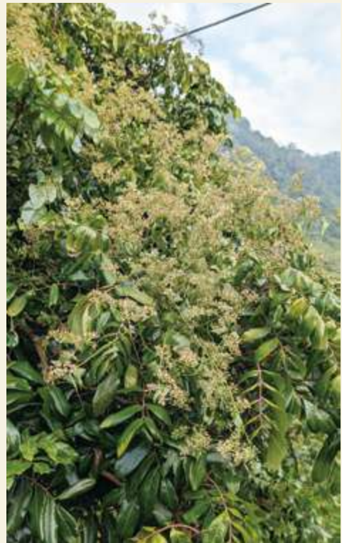
▲ 原產於南美洲的「小花蔓澤蘭」便是經由人為傳播而來的「外來入侵種」，造成淺山植物枯萎凋亡，又稱「綠色之癌」/ 陳文彥

例如淺山中很常見到自南美洲引進的「小花蔓澤蘭」，其心型的葉片，雪白的小花，看起來像是點綴山林的「浪漫雪花」，但它為了獲取陽光而纏勒、覆蓋在其他植物上，導致該植物無法行光合作用而枯死，嚴重破壞淺山林相。此外尚有常見的黃金葛，近年流行的合果芋、蔓綠絨等觀葉園藝植物，也正以美麗的樣貌「攀岩覆地」取代淺山中的原生植物。