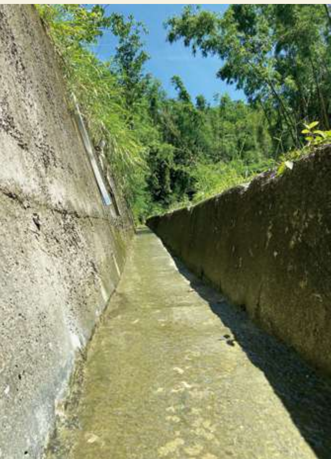
▲ 三面光水溝可說是「生態陷阱」 / 張俊逸