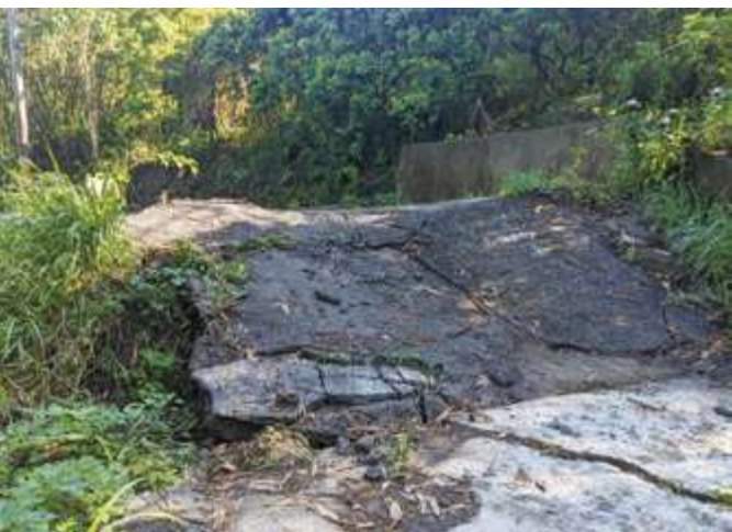
▲ 0121 嘉義中埔大地震造成臺南關子嶺道路隆起變形

而「木屐寮－六甲斷層」抬升斷層東側上盤的淺山地帶，於清同治元年（1862）造成居民慘重傷亡，導致「茅港尾」聚落衰敗，嘉南地區眾多寺廟倒塌重建的大地震。但臺南重要的白河、尖山埤、烏山頭水庫，則都善用「木屐寮－六甲斷層」造成的淺山與平原地形落差，建立起對農業及人文聚落發展貢獻卓著的水利設施。