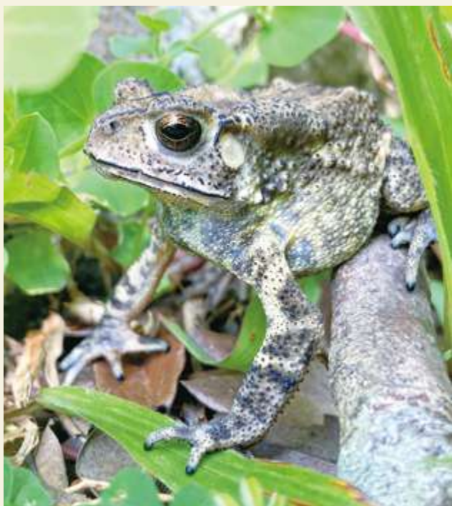
▲ 黑眶蟾蜍 / 張家瑜

目前淺山許多動、植物因棲地被「過度開發」，能夠躲避、覓食的地方減少而數量銳減，成為人們口中的「明星」物種。以動物為例，例如石虎、穿山甲、食蛇龜等，皆是以這種形象在保育宣導中「出道」。