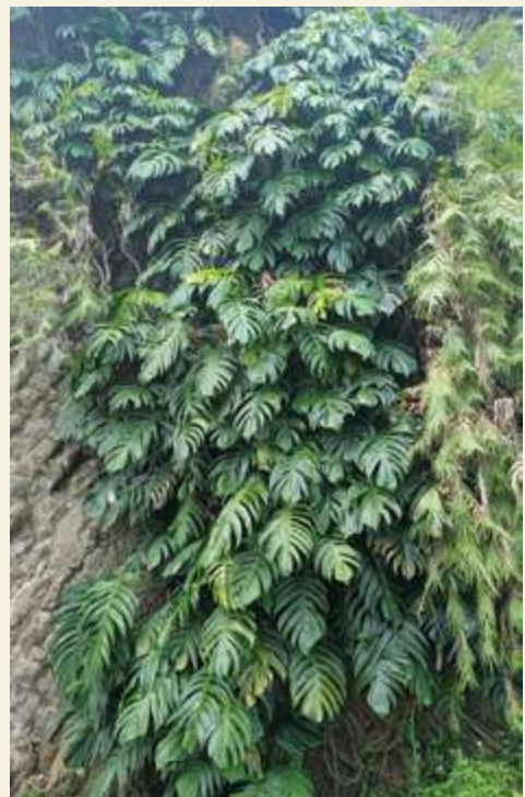
▲ 自國外引進的觀葉園藝作物，因人為逸散而對淺山生態多樣性造成危害 / 陳文彥