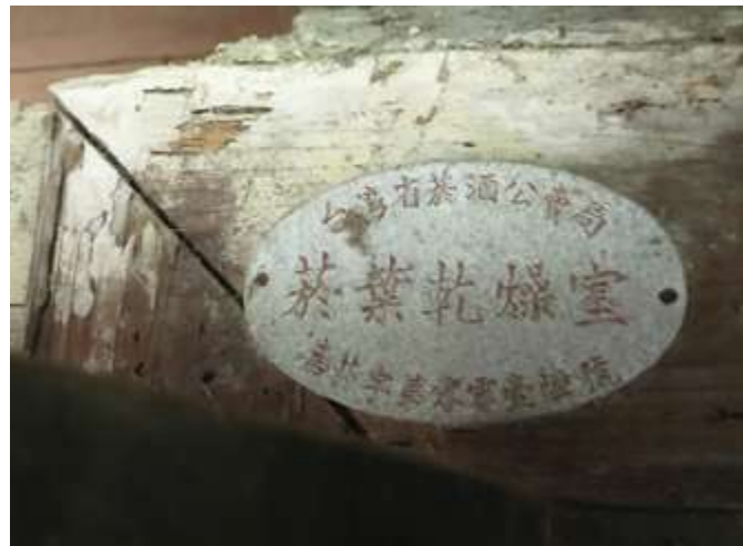
▲ 葉家菸樓門上還貼有菸酒公賣局所核發的 0016 號菸草乾燥室的登記標誌

為名的「菸葉產業」校訂課程，並結合校方設計的「走進涓涓頭前溪—臺南白河客家巡禮地圖」摺頁，內容涵蓋白河地區客家宗祠與菸樓簡介，搭配學生現地教學，成果斐然。