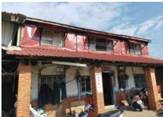
▲ 內枋林彭家菸樓與住屋