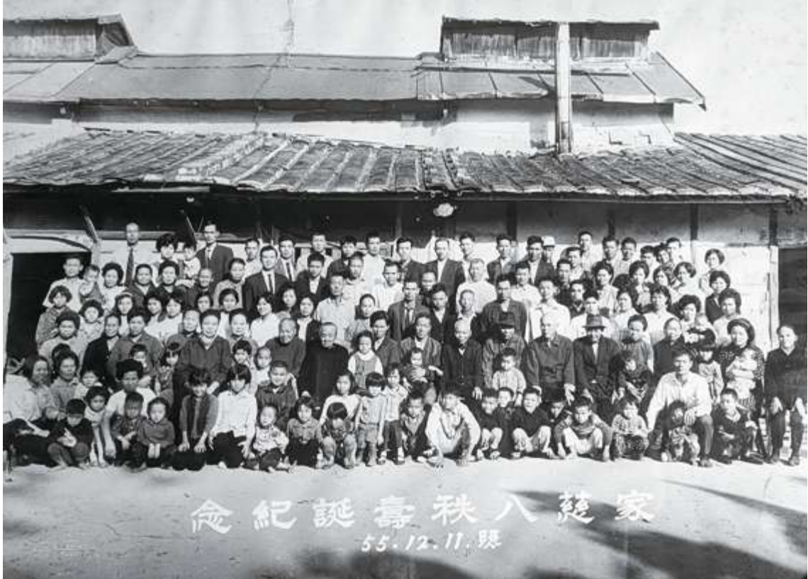
▲ 民國 55 年葉家族人齊聚菸樓前合影，可以想見當時菸業的興盛，為葉家眾多人口帶來繁榮昌盛的生活 / 陳文彥翻攝葉家老照片

女士回憶起剛來林子內定居開墾時，家族成員都十分辛苦。早在日治時期，日本政府鼓勵人民種菸、製菸，加上菸草屬於高經濟作物，有「綠色黃金」之稱，因此戰後持續有人從事菸葉產業。