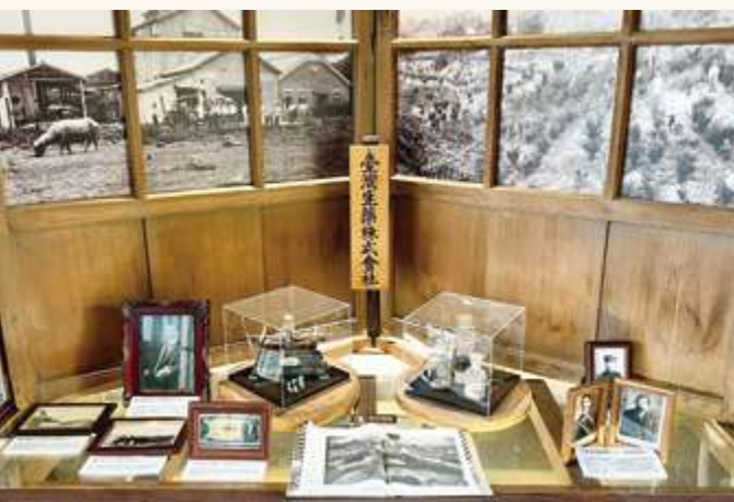
▲ 展區中「臺灣生藥株式會社」的發展歷史與相關人物介紹，並有天秤、燒杯、藥瓶等老物件展示 / 陳文彥