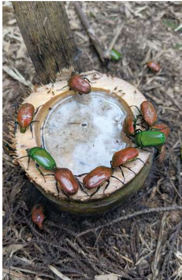
▲ 採收竹子所留下的竹管，因積水而成為水生生物的微棲地，並吸引其他生物聚集

「淺山」一詞並無「生態學」的定義，主要是描述「人類開發區域」過渡到「自然環境」的概念，通常指海拔 800 或 1000 公尺以下「不包含平地」的區域，泛指臺灣低海拔的丘陵。「大新營六區」的東山、柳營、白河區境內，便佔有廣大的淺山地形。