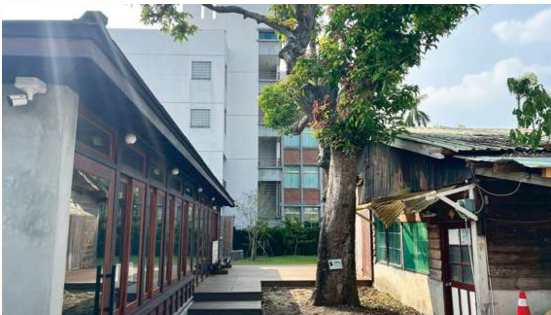
▲「新東舊時光」內有一株百年老芒果樹，是當年的日籍工人所種，並曾於十多年前來臺探望老樹 / 陳文彥