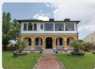
劉啟祥美術紀念館 Liu Chi Shiang Memorial Hall

臺南市柳營區中山西路三段 112 號 電話：06-6227168 開館：週三至週日 10:00 ~ 17:00 週一、二休館