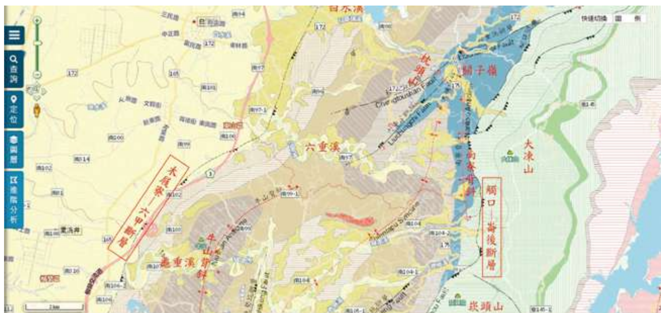
▲ 位於「木屐寮－六甲斷層」及「觸口－崙後斷層」之間的「大新營區淺山地帶」地質圖 / 地質資料整合查詢圖台

臺南東北區域的「淺山」，不只是一片丘陵山區的籠統概稱，在地質方面，以「木屐寮－六甲斷層」為西界，以「觸口－崙後斷層」為東界，把界於廣袤嘉南平原和臺南最高峰大凍山之間的「大新營區淺山地帶」明確界定出來。