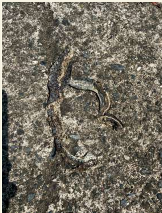
▲ 路殺的蛇類屍體 / 張俊逸