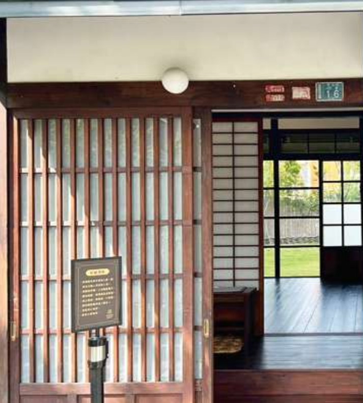
▲ 走進掛有「藥舍」門牌的入口，彷彿體驗日治時期「藥仔會社」員工生活 / 陳文彥