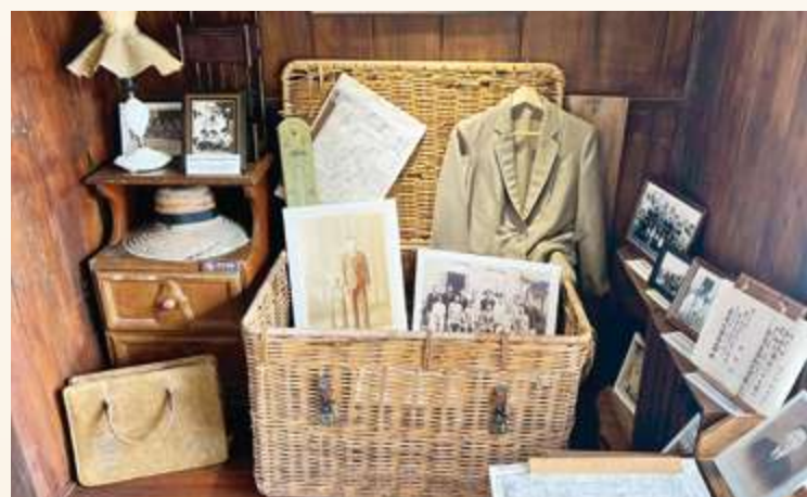
▲ 「臺灣生藥株式會社」的員工合影、衣著、用品，及當時報紙的相關報導，是古柯產業曾在新營發展的珍貴史料