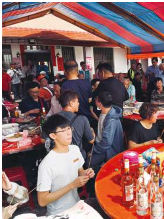
▲ 十八重溪的庄內信徒於「佛祖媽」出巡時準備豐盛的供品，並於中午宴請親友同歡 / 林宗逸