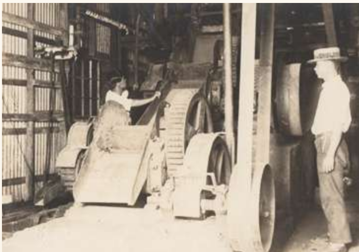
▲ 乾燥後的古柯葉送入機器輾碎 / 劉興吉