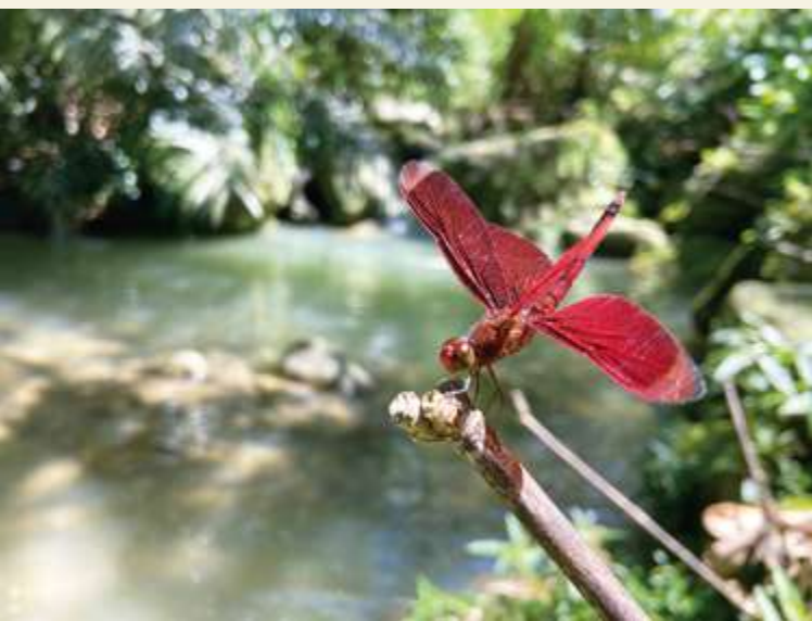
▲ 善變蜻蜓 / 張俊逸