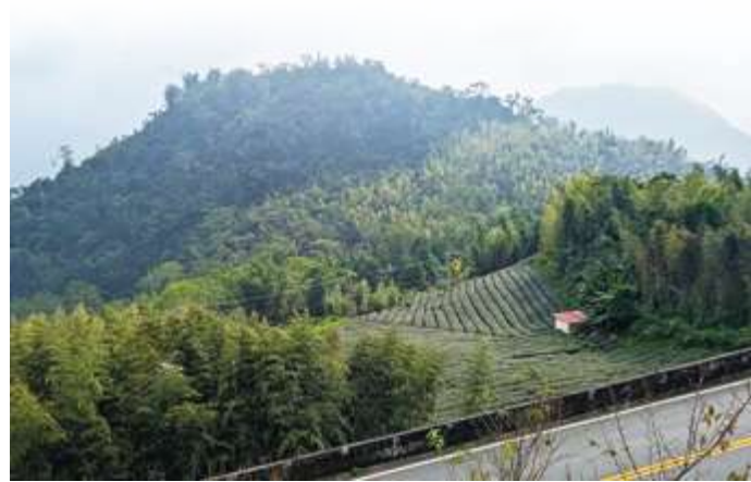
▲ 淺山地區可見人類開發的茶園、果園、竹林與自然森林的過渡景象