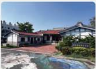
吳晉淮音樂紀念館 Wu Jin-Huai Memorial Hall

臺南市柳營區界和路 158 號 開館：週三至週日 10:00 ~ 17:00 週一、二休館