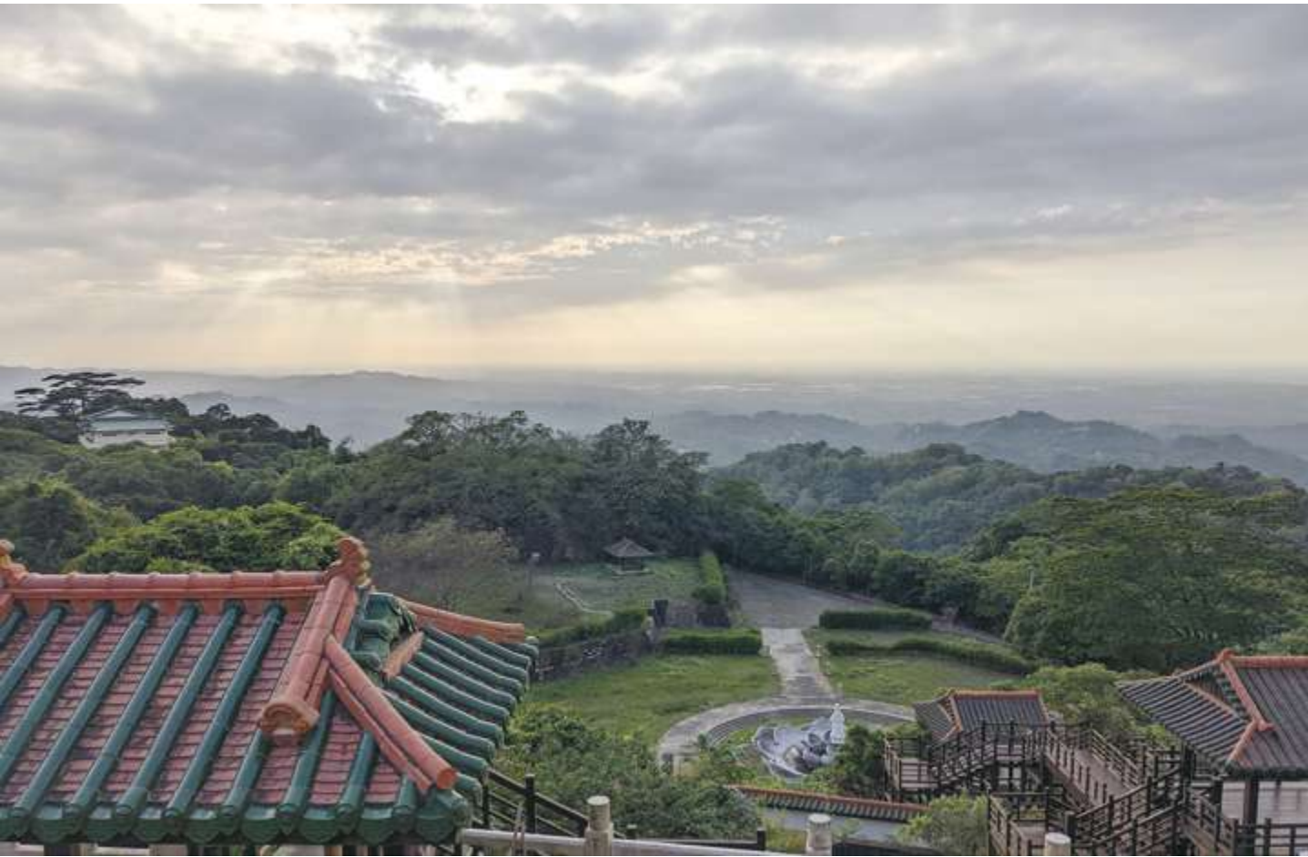
▲ 於關子嶺碧雲寺前眺望，可以看見十八重溪流域，也是「哆囉嘓」到「前大埔」間的區域 / 盧維笙

間有一、二支流附入，非十八條溪水橫流而過也。……自諸羅邑治出郭，南行二十五里至楓子林，皆坦道，稍過則爲山蹊。十里至番子嶺。嶺下爲一重溪，仄逕紆迴，連涉十五重溪，則至大埔庄，四面大山環繞，人跡至此止矣。東南有一小路，行二十五里至南寮，可通大武壠社，高嶺陡絕。」