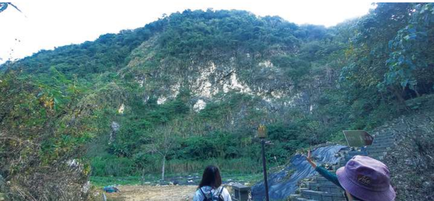
▲ 枕頭山與其裸露的白色石灰岩山體 / 陳文彥

派社」，數百年前在漢人入墾後的急遽社會變遷下，陸續遷移至枕頭山下的岩前部落、六重溪流域，基督長老教會與散布的公廨，形成獨特的淺山平埔文化。