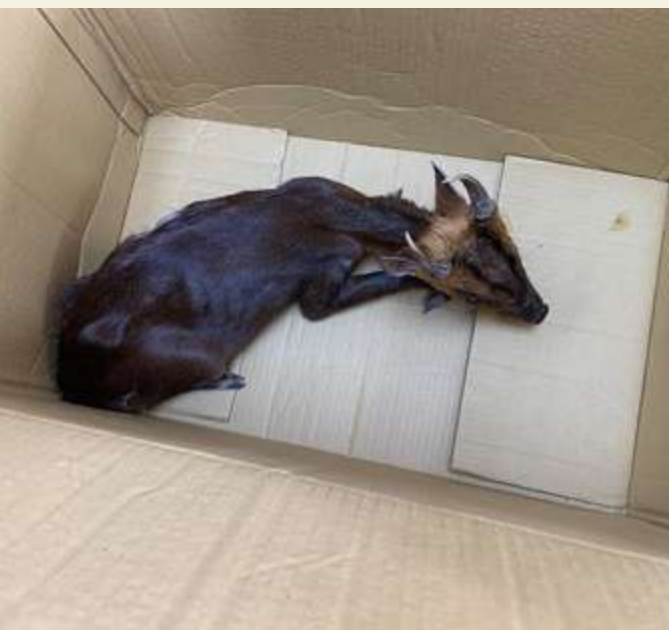
▲ 受到驚嚇而受傷死亡的山羌 / 蔡亞軒

而開發必定為原本沒有道路的地方帶來頻繁的交通流量，於是我們會在柏油路上看到被「路殺」而乾扁的青蛙、蛇、烏龜或甲蟲等。道路旁的山坡也經常以水泥整面鞏固，雖然可能阻止了雨水沖刷造成土石流，但也失去這一塊棲地與原本生長在上面的生命。