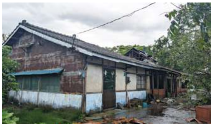
▲ 2025 年 7 月的丹娜絲颱風對葉家菸樓造成嚴重破壞

竹門國小教學團隊長期致力於客家文化課程化與生活化，於民國 112 年調查到菸樓現存與遺址共有 16 座（處），這些菸樓家族成員多數與客家族群有淵源，並於民國 113 年起開始規劃設計以「白河綠金」