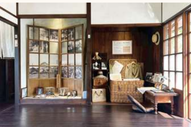
▲ 「新東舊時光」內的藥舍展區 / 陳文彥