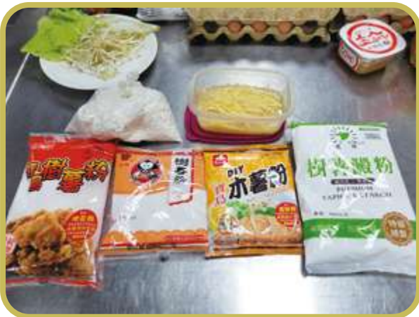
▲ 市面上的各種樹（木）薯粉