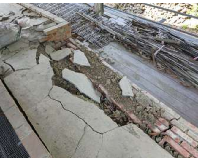
▲ 0121 嘉義中埔大地震造成臺南東山地區大量的龍眼焙灶窯毀損 / 盧維笙