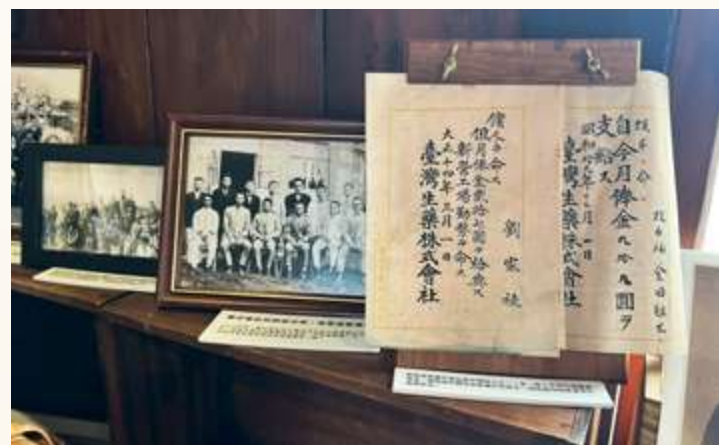
▲ 「臺灣生藥株式會社」的員工薪資條及員工社團合影 / 陳文彥