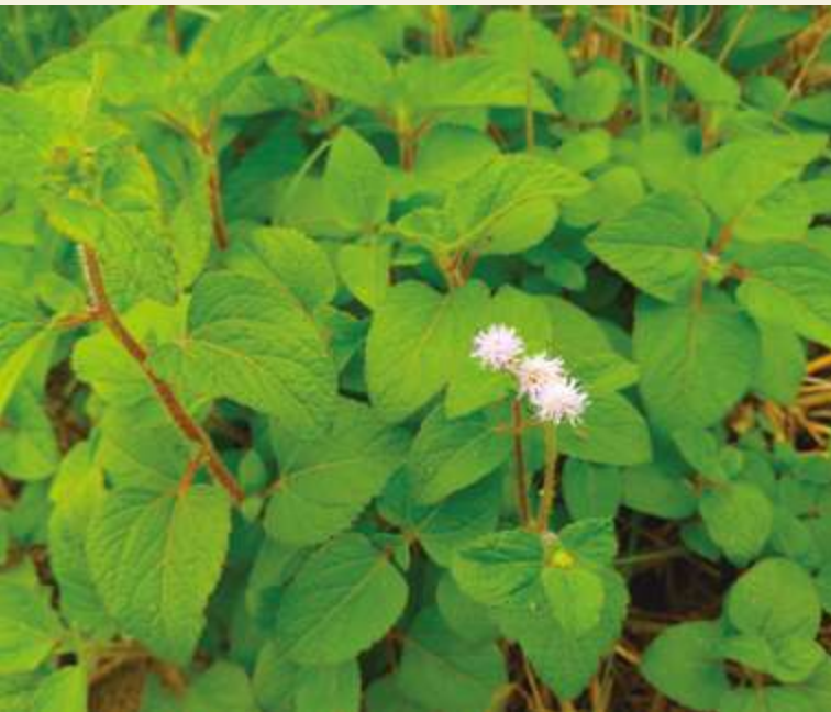
▲ 登山步道常見到的紫花藿香薷，也是對原生植物造成競爭壓力的外來入侵種 / 陳文彥