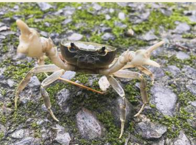
▲ 黃綠澤蟹 / 張俊逸