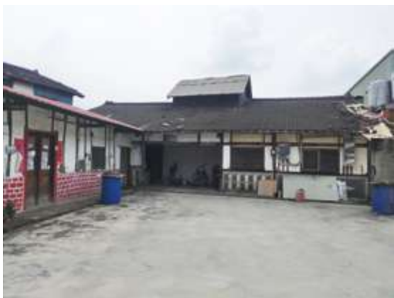
▲ 草店大埔李家菸樓