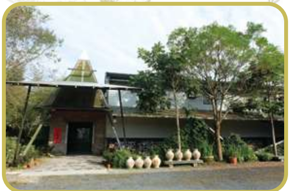
▲ 位於白河崎內的「白河陶坊」，過去有段時期曾是製粉工廠的廠區

樹薯在東南亞也是很常見的食材，尤其在印尼，幾乎家家戶戶都有種植；臺灣現今有越來越多東南亞的新住民、移工生活，樹薯的鮮食需求提高，反而因此讓樹薯與樹薯葉重新在市場上銷售。📍