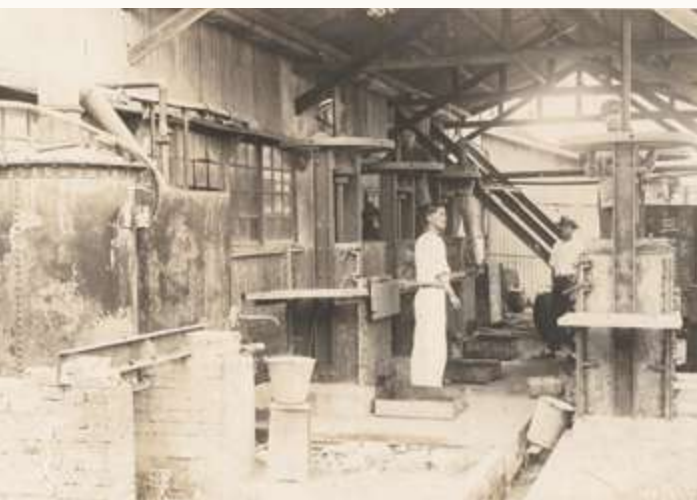
▲ 藥廠工人操作機器

今日嘉義縣中埔一帶的社口關建農園，進行古柯栽培。另一個重要的古柯園，也在離嘉義不遠處的白河地區出現。