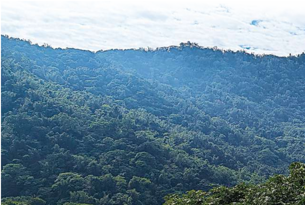
▲ 位於東山區的崁頭山，是臺南市第三高峰，沿途有咖啡莊園與柑橘果園，是適合觀察「淺山」生態的地方 / 陳文彥