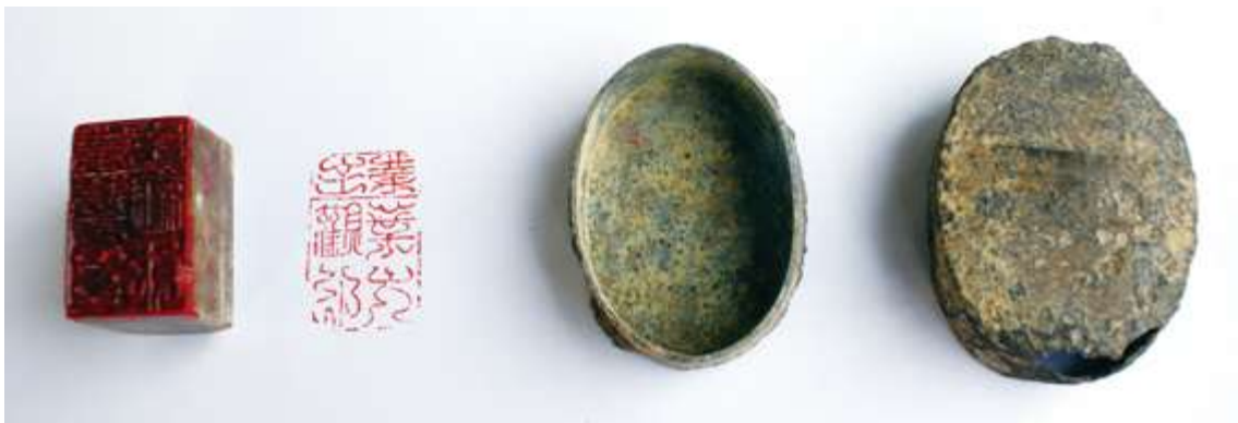
▲ 刻有「業主葉大觀印」的印章 / 陳志昌