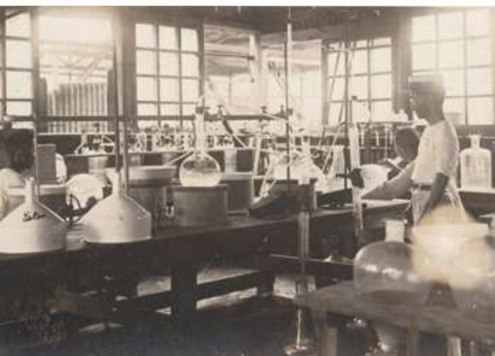
▲ 藥廠人員進行古柯葉萃取