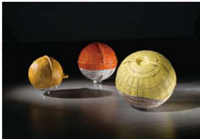
▲ 廖昭豪《消波塊與浮球》