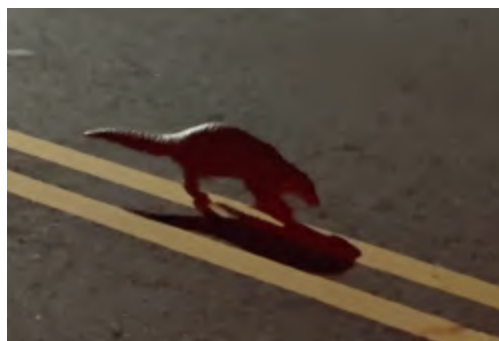
▲ 夜行性的穿山甲，在淺山的過度開發下，面臨路殺或是遊蕩犬、貓的攻擊

淺山地區就像人類與野生動物接觸的前線，衝突容易在這裡發生，但理解也可以在這裡發生。人類是生態系中的一員，但與野生動物不同的地方在於，人類有同理與思考的能力，可以為生態系做更多事。🐾