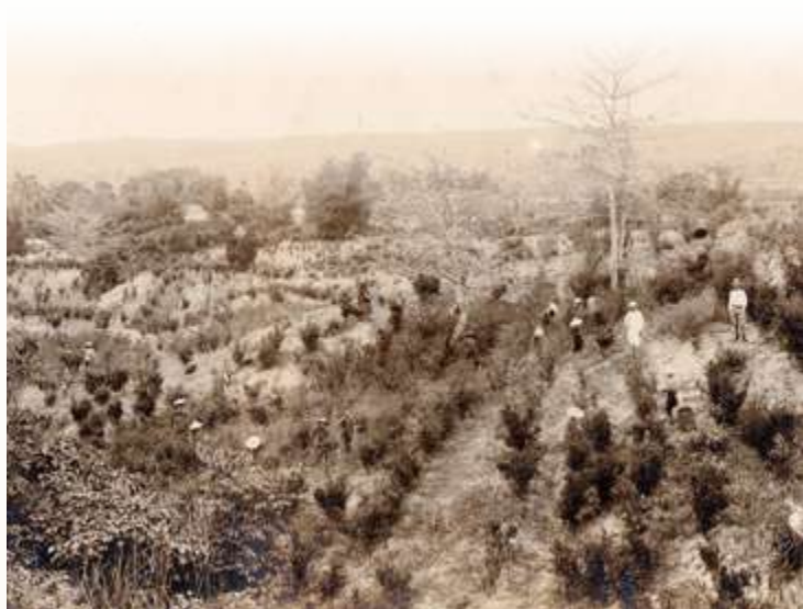
▲ 臺灣生藥會社白河農場 / 劉興吉

古柯種植在經過多年試驗而成功，並扶植日商開闢古柯園，如當時日本國內首屈一指的藥品公司「星製藥株式會社」，就在