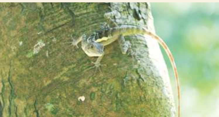
▲ 斯文豪氏攀蜥 / 張家瑜

淺山地區因氣溫適宜、地形多樣、溪流遍佈、多樣的植被，非常適合動物生活；加上常有果園、菜圃座落，附帶水桶器皿，偶有農舍提供小動物遮風擋雨的角落，更增添了「微棲地」分佈，吸引更多物種覓食與棲息，例如：山羌、白鼻心、穿山甲、石虎、臺灣獼猴、山豬、飛鼠及各種蛙類、蝶類、蛇類、蜥蜴、烏龜，或季節性的螢火蟲與獨角仙等。