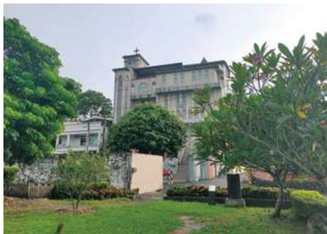
▲ 白河區岩前部落及岩前教會

白河區的知名地景「枕頭山」，因日治時期大量開採石灰，形成「仙草埔聚落」石灰產業，帶動臺灣糖業的蓬勃發展。這醒目的灰白山頭，竟是源自兩百萬年前、一度處於淺海環境下大量生成的生物礁岩，隨著斷層活動、地殼抬升、差異侵蝕等地質作用，經百萬年淬鍊而成石灰岩質的白玉山頭，見證著淺山地帶自然資源的豐富與應用，也證明臺南東北地區的淺山地帶，是個適合自然教育、人文產業並重輝煌的散策好所在！📍