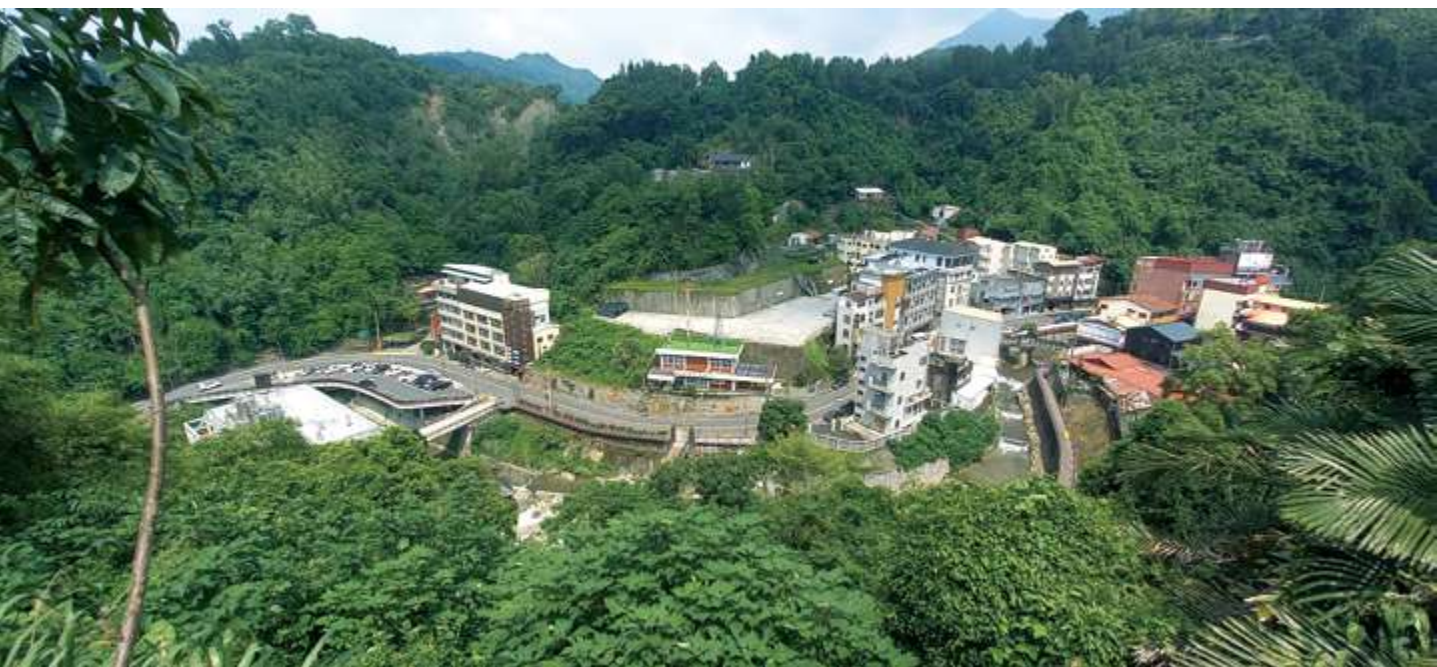
▲ 關子嶺溫泉聚落 / 陳文彥