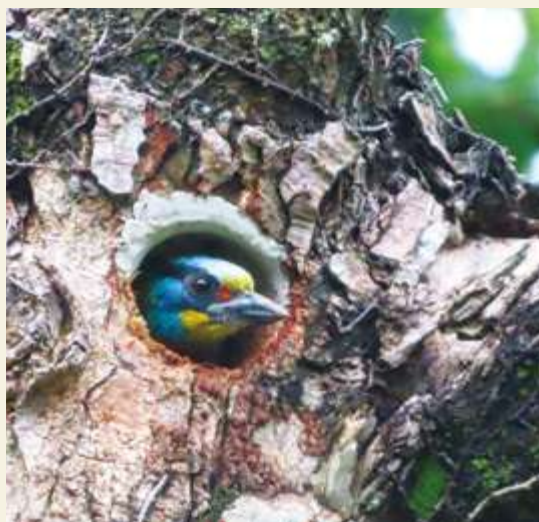
▲ 五色鳥 / 張家瑜