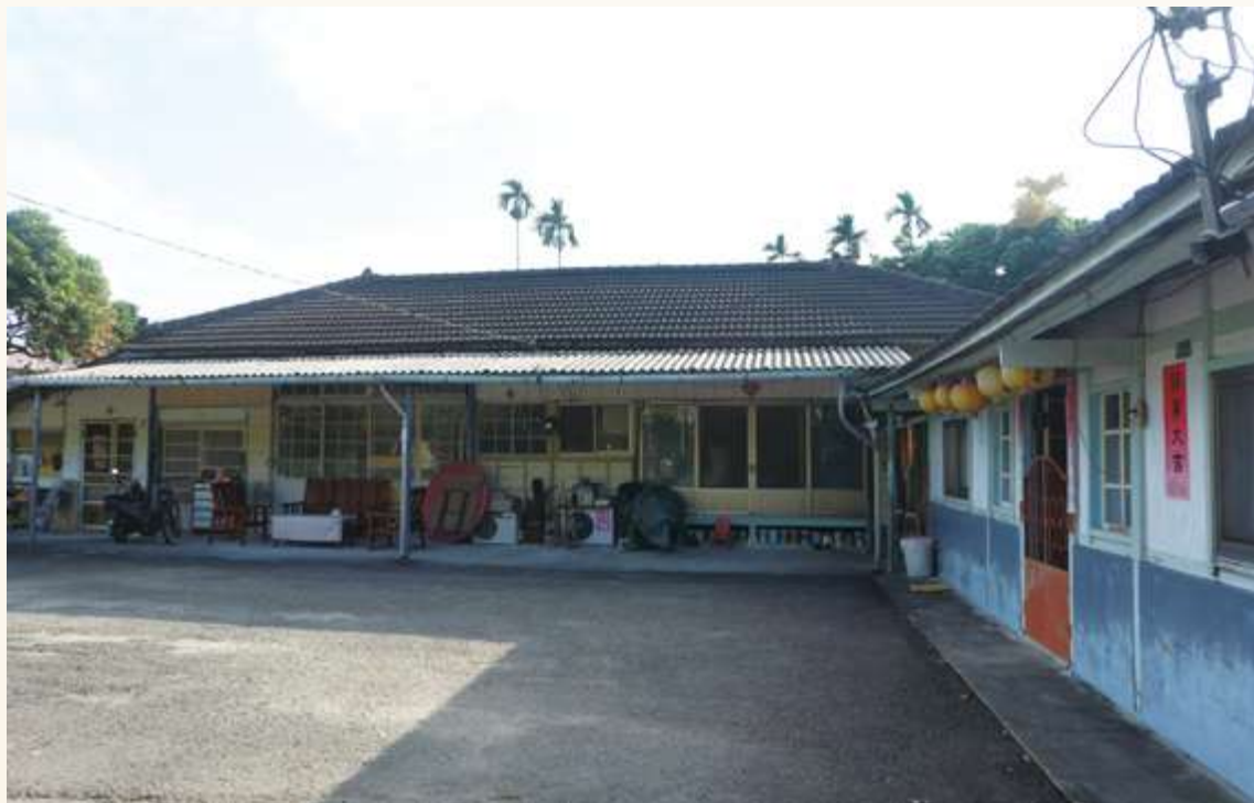
▲ 白河區崎內里所留下臺灣生藥會社時期的建物

古柯種植栽培地區也因國際條約的限制，並未在臺灣其他地區擴張，反而集中在嘉、南山區最初設立的中埔、白河兩個古柯農園，這些在嘉南淺山地區發展的農場，也帶來許多外移人口，許多來自桃竹苗地區的客家移民，亦在此地落地生根。