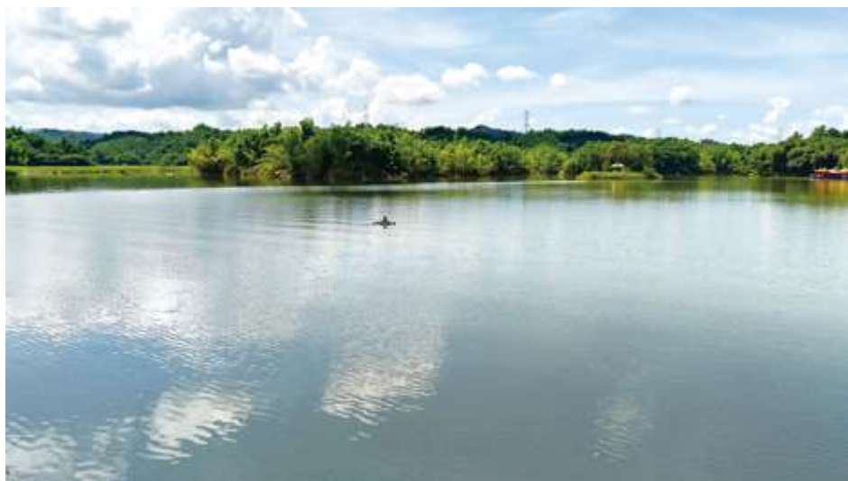
▲ 尖山埤水庫水源來自龜重溪的支流 / 陳文彥