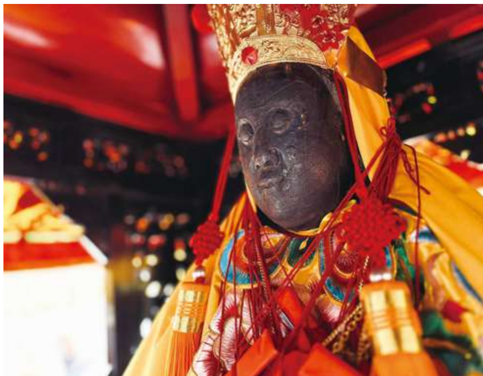
▲ 碧軒寺觀音佛祖，在地人慣稱「佛祖媽」或「正二媽」

若從「十八重溪內請佛祖」的路徑及庄頭分布來看，這條路線與產業道路與民俗路線重疊，若從「文化路徑」的角度來看，這是現代交通設施興起之前，人們爲了生活、貿易等目的而開鑿或自然形成的道路，具有歷史文化價值與遺跡，是觀察先民足跡、了解在地歷史的路線載體。