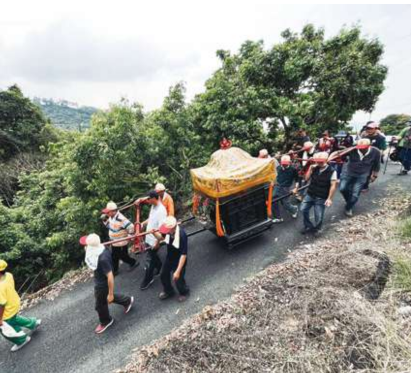
▲ 對於東山人而言，「佛祖媽」農曆二月十日出巡十八重溪結束，才是真正圓滿新年慶典 / 林宗逸