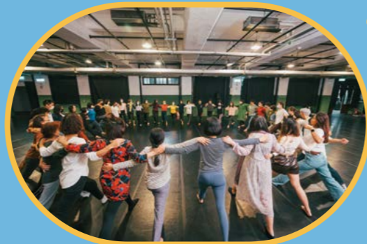
▲【涓流】微光製造 《小手牽大手作伙跳舞的開始》工作坊

我們常用水的流動性借代時間的推移，逝者如斯的似水年華。而水的多變型態，恰如我們肢體延展的各種可能，因此策展團隊精心設計，以「水」呼應不同年齡層的身體與社會經歷，開展出三個不同年齡樣態的特色工作坊：