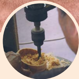
▲ 以平台式鑽床粗略鑽挖苓蓋內部，鑽挖過程須避開苓喉定位處