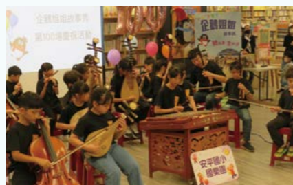
▲ 安平國小樂團演出 ◀ 政大書城多元的閱讀推廣活動—企鵝姊姊故事秀