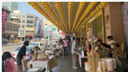
◀ 政大書城臺南店今年新春首次舉辦「踏冊郎」燈節