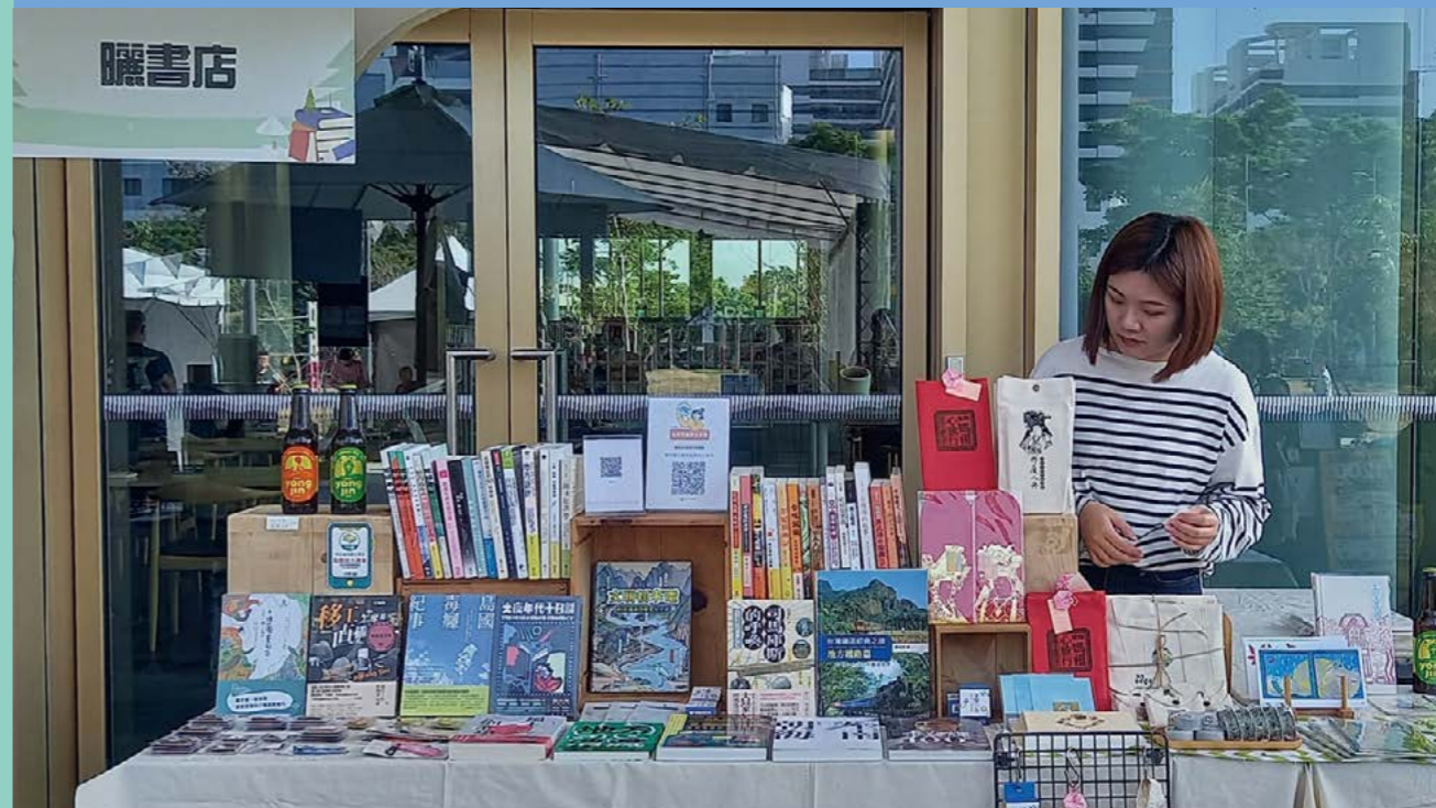
▲ 新營曬書店在永康擺攤狀況 / 臺南好本市