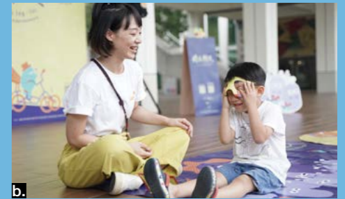
a-b. 深受歡迎且充滿活潑互動性的「故事三輪車」，以「兒童」為主角，透過臺語說故事，引導幼兒思考提問，以不同角度認識成長過程中面對的議題。