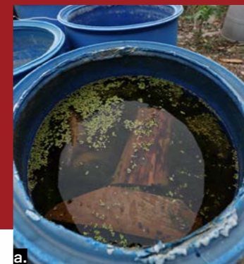
a. 早期的鴿苓是採用白樹製作，謝榮哲則改用更輕量柔韌的黑板樹，而製作前的木料要先泡水半年，讓木料在飽水狀態時進行裁切刨挖等工序，避免變形與斷裂