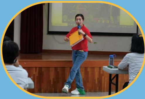
◀【交流】秀琴歌劇團 x 銀齡長者 x 微光製造 《唱跳攏佇遮 Swing 冰菓室》工作坊