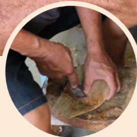
▲ 以平鑿修整圓角之圓弧度及斜度