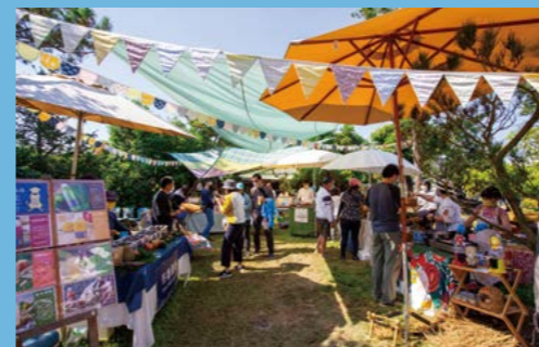
▲「水花市集」在 4/13-14 將搭配開幕活動熱鬧開市。

擔任新營藝術季藝術總監的汪兆謙，從 2009 年便帶領阮劇團在嘉義進行草草戲劇節，這樣豐沛的熱忱與在地情懷，也促成他與新營文化中心多次合作。他認為過去的新營藝術季比較偏場次取向的活動節目，在經過多年的推行，藝術季應該更可以賦予「春季節慶」意象，用帶狀連貫的主題活動，深化與地方的連結。