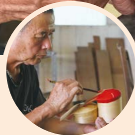
▲ 將紅色油漆加入適量松香水，並攪拌均勻。再利用油漆筆或毛筆將苓蓋刷上紅漆