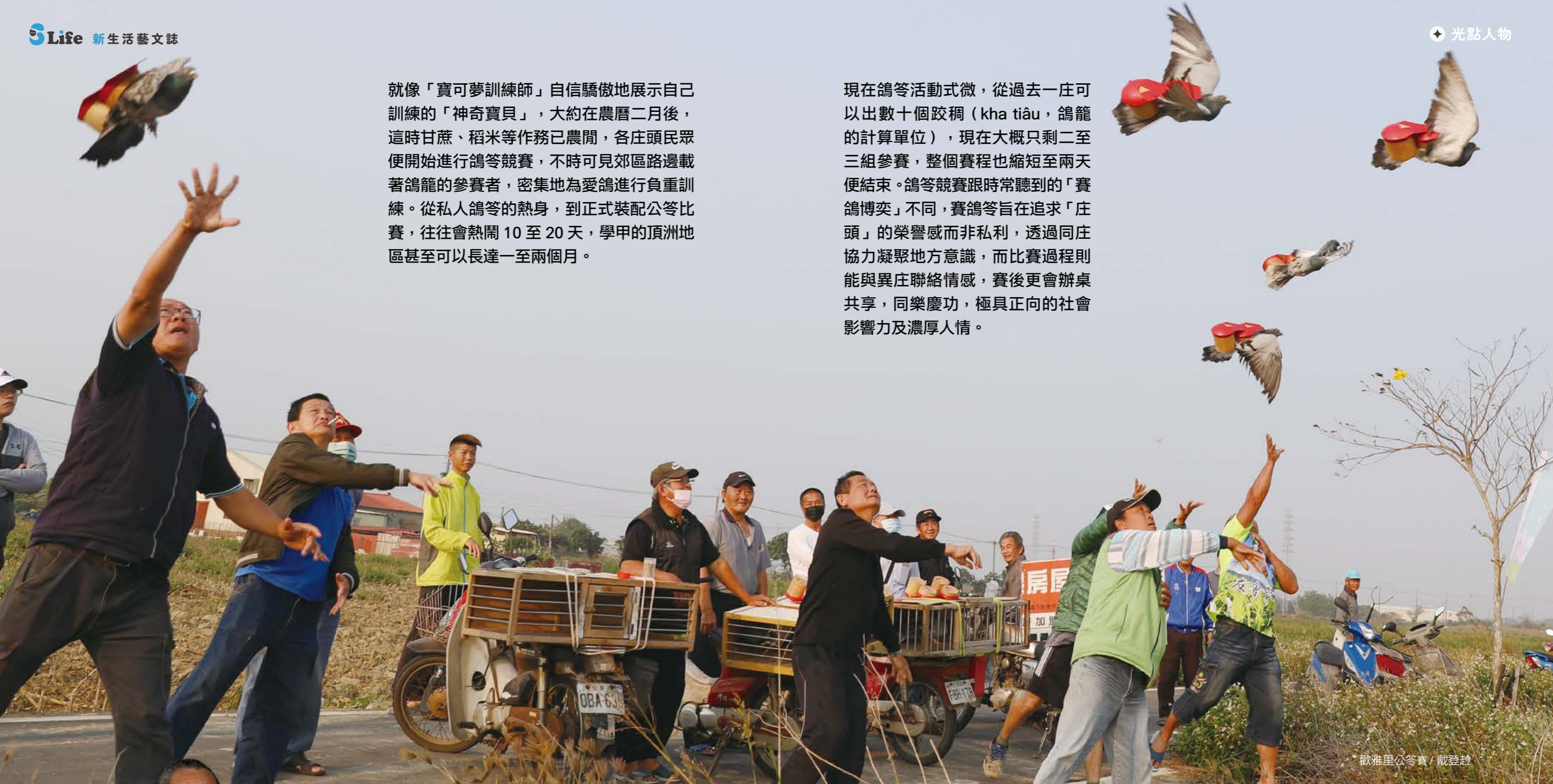
歡雅里公笞賽 / 戴登趁

現在鴿笞活動式微，從過去一庄可以出數十個跤稠（kha tiâu，鴿籠的計算單位），現在大概只剩二至三組參賽，整個賽程也縮短至兩天便結束。鴿笞競賽跟時常聽到的「賽鴿博奕」不同，賽鴿笞旨在追求「庄頭」的榮譽感而非私利，透過同庄協力凝聚地方意識，而比賽過程則能與異庄聯絡情感，賽後更會辦桌共享，同樂慶功，極具正向的社會影響力及濃厚人情。