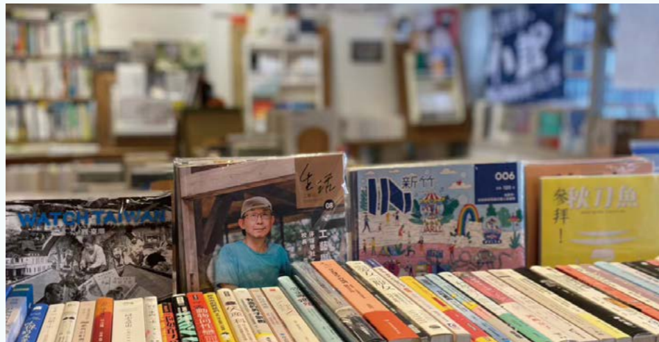
◀ 重視在地生活，選書充滿臺灣的地方特色

位在北臺南新營區的曬書店，三層樓透天的老屋前身是旅社，地板的美麗花磚是一大特色，獨特的空間結構，以充滿手感及溫度的舊物為書架，也陳設販售在地友善環境的農特產和文創小物。