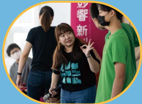
▲【奔流】影響·新劇場 《青春行動代號：足水啦！》工作坊