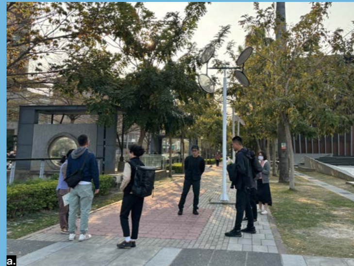
a. 策展團隊場勘 b. 策展團隊合影

「去年秋天，我們在綠川上看著水流與葉間透下的光影，在水一方的我們，想著今年臺南 400 年，這麼漫長的時間，水帶來了什麼改變？在這個地方留下了什麼樣的痕跡，直到變成現在的新營？」王宇光與李尹櫻回憶著。在我們的想像中，新營是個全齡宜居的城市，而「水」為嘉南平原帶來豐厚的農產，也為新營創造曾經興盛的糖業與繁榮，因此藝術季發想「水水」的起點，除了是諧音臺語「美好」的開始，也希望藉由「SWEET SWING」讓每個參與藝術季的人都能在這個美好的春季中，以甜蜜的心情愉悅地開始搖擺身體。